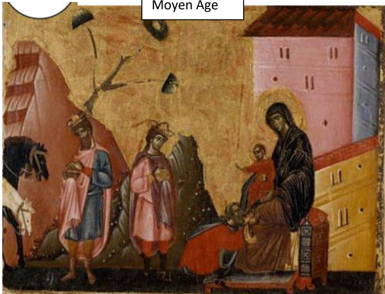
L'Adoration des Mages, Guido de Siena, 1270. Détrempe sur panneau de bois.